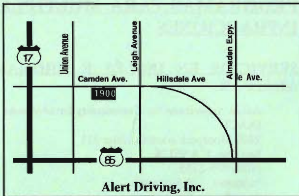
Alert Driving, Inc.