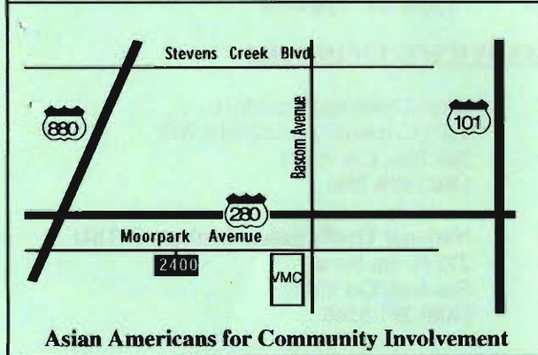
Asian Americans for Community Involvement